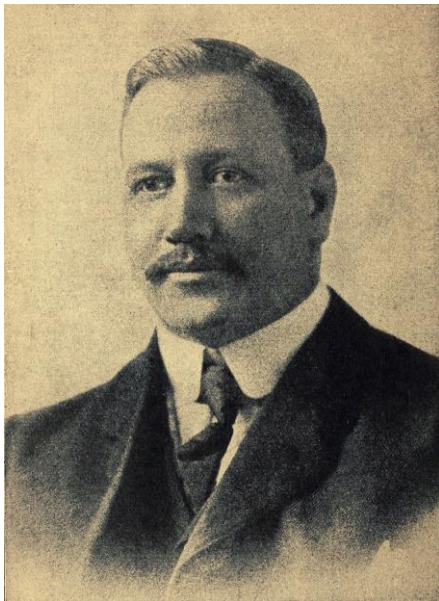
WILLIAM GEORGE MORGAN ( criador do voleibol)

Em 1947, foi fundada a Federação Internacional de Voleibol (FIVB). Dois anos mais tarde foi realizado o primeiro Campeonato Mundial de Voleibol. Na ocasião, só houve o evento masculino. Em 1952, o evento foi estendido também ao voleibol feminino. No ano de 1964, o voleibol passou a fazer parte do programa dos Jogos Olímpicos, tendo-se mantido até a atualidade.