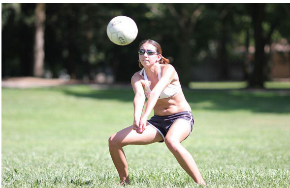
Passe realizado com manchete.

Manchete é um golpe executado por um jogador de voleibol, realizado com os antebraços unidos e com os braços estendidos para que a bola não toque no chão. O jogador tentará receber o saque adversário efetuando um passe para o levantador