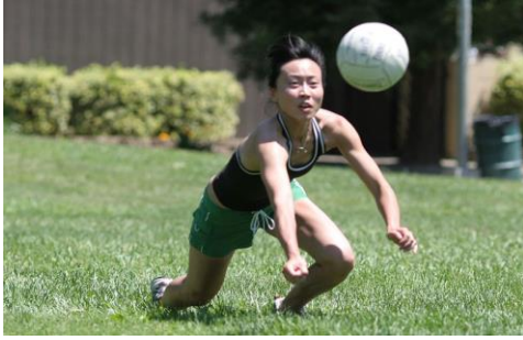
Jogador realizando uma defesa.