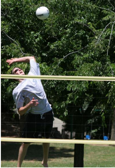
Jogador realizando um ataque