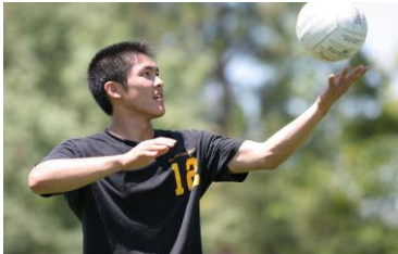
Um jogador se preparando para sacar.

O saque ou serviço marca o início de uma disputa de pontos no voleibol. Saque por baixo ou por cima