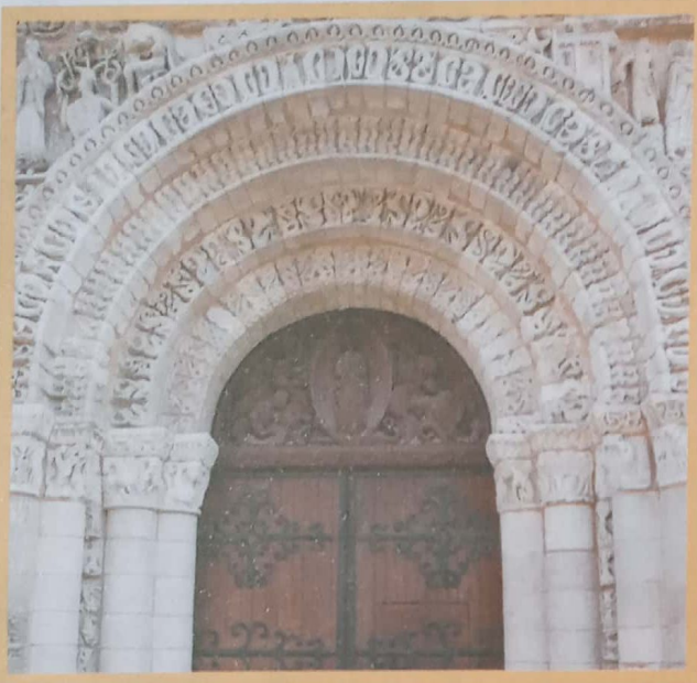
Detalhe do tímpano da Catedral Notre-Dame la Grande

abóbadas: tetos curvilíneos encontrados em algumas igrejas.