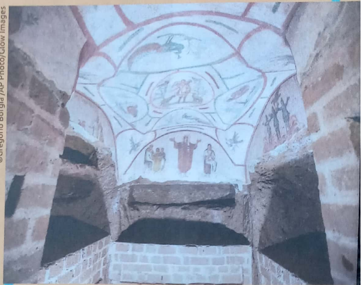
Mural das catacumbas de Priscilla, Roma, Itália