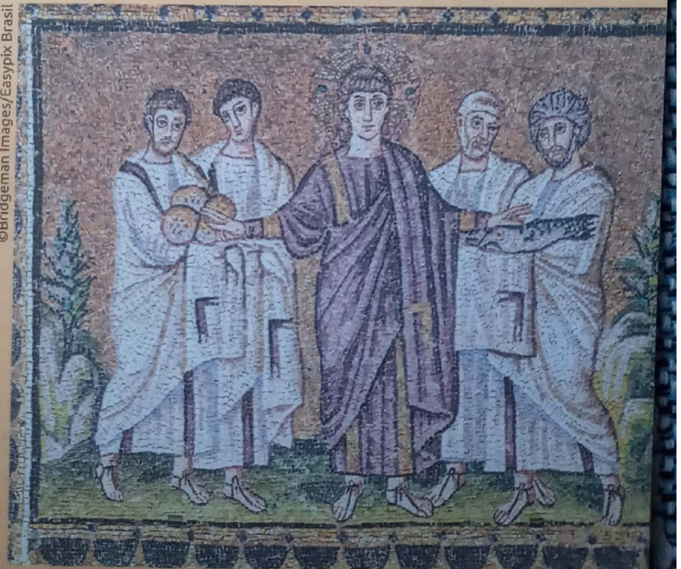
O MILAGRE dos pães e dos peixes. [ca. 520]. 1 mosaico. Basílica de Santo Apolinário Novo, Ravena, Itália. Detalhe.