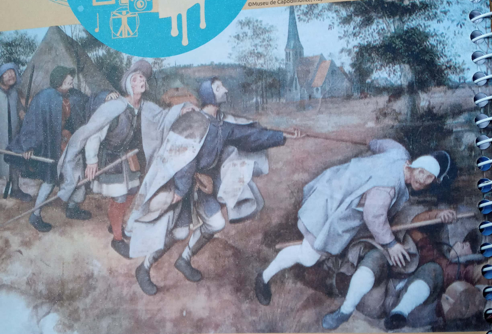
BRUEGEL, Pieter (O Velho). A parábola dos cegos . 1568. 1 têmpera sobre tela, 86 cm x 154 cm. Museu de Capodimonte, Nápoles, Itália.