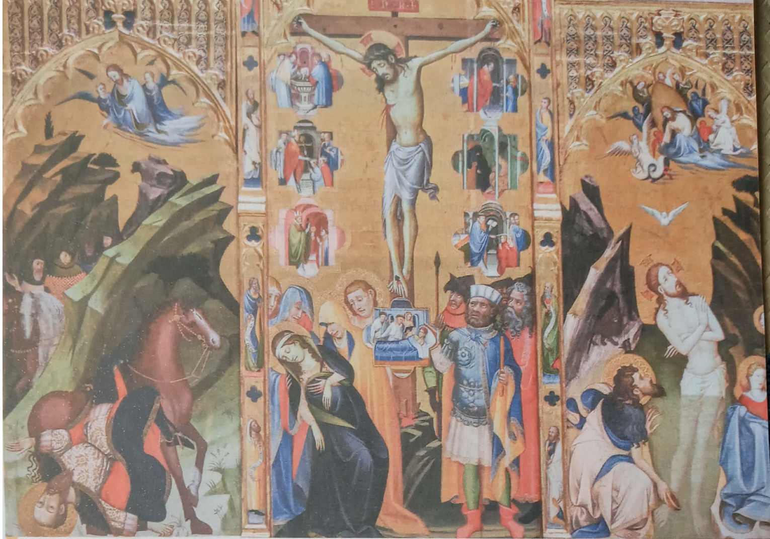
Retábulo medieval que retrata a conversão de São Paulo, Jesus na cruz e o batismo de Jesus, Catedral de Valência, Espanha

Os retábulos eram estruturas de madeira, mármore ou outro material, colocados atrás ou sobre o altar. Normalmente, eram compostos de um ou mais painéis pintados ou em baixo-relevo.