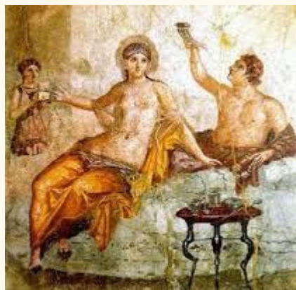
Fresco de uma casa de Herculano

A arte romana também se fez presente na decoração. Em Pompéia, veremos o luxo das casas com suas paredes decoradas, mosaicos diversos e utensílios domésticos.