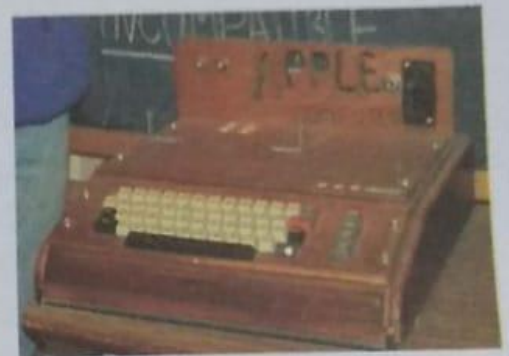
Original Apple II

Em 1976, Jobs e Wozniak instalaram uma "fábrica" de computadores, na garagem da casa da família de Jobs na Califórnia. Ainda em 1976 é lançado o computador "Apple I", o primeiro computador pessoal, vendido já montado, que era apenas uma placa mãe coberta com alguns chips e instalada em uma caixa de madeira.