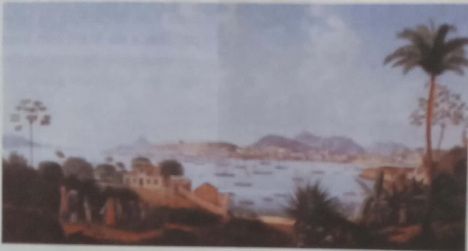
TAUNAY, Félix Émile. Baía de Guanabara vista da Ilha das Cobras . [ca. 1828]. 1 óleo sobre tela, color., 66 cm x 136 cm. Coleção particular, Rio de Janeiro.

Chefiada por Joaquim Lebreton, a missão tinha como objetivo inserir o Brasil no contexto artístico daquele tempo, para satisfazer as necessidades da corte. Para isso, em 1816, foi criada a Escola Real de Ciências, Artes e Ofícios, depois nomeada Academia Imperial de Belas-Artes – atualmente conhecida como Escola de Belas-Artes e integrada à Universidade Federal do Rio de Janeiro. Dois pintores da missão se destacaram pelo teor e pela quantidade de suas produções: Félix Émile Taunay (1795-1881) e Jean-Baptiste Debret (1768-1848).