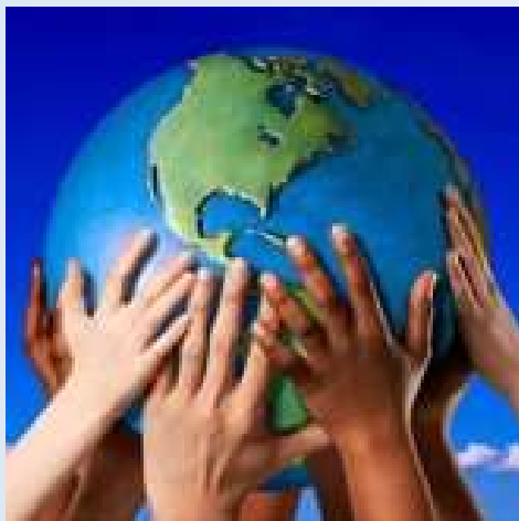
Imagem: Mãos segurando o mundo

O que devemos chamar de Globalização deve-se, sobretudo, ao aprofundamento dos processos de integração social, como a economia, a política e a cultura, impulsionada pela evolução e pelo barateamento dos meios de transporte e comunicação, principalmente na segunda metade do século XX e posteriormente no século XXI.