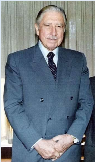
Ditador chileno Augusto Pinochet.

Com a queda do governo socialista de Salvador Allende, na década de 70, assume o poder no Chile o ditador Augusto Pinochet, fazendo com que o Chile, antes das mesmo das potências europeias e americanas, seja o primeiro país a de fato implantar políticas neoliberais. O que de certa forma viria a contribuir para que outros países da América Latina, como o Brasil, com Fernando Henrique Cardoso, a Argentina e o México, adotassem o mesmo sistema anos mais tarde.