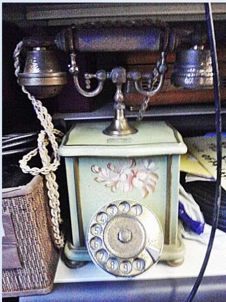
Imagem: Telefone antigo