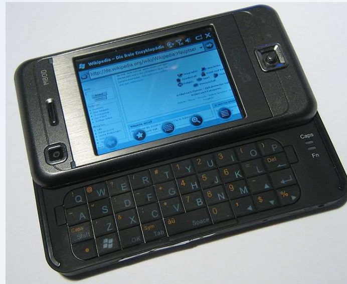
Imagem: Eten Glofish M800 / Redeemer / Creative Commons Attribution 3.0 Unported.