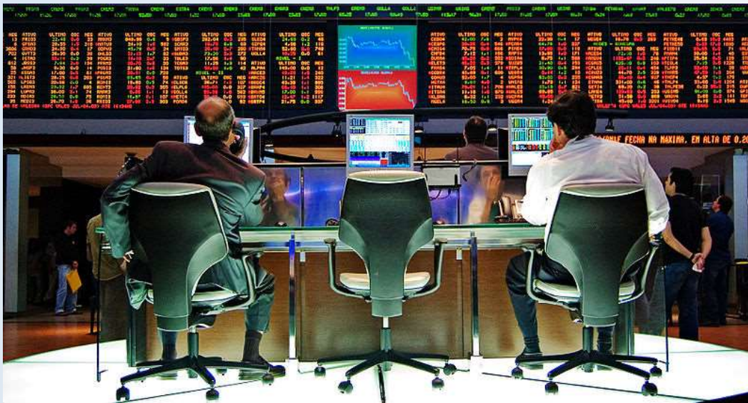
Imagem: A Bolsa de Valores de São Paulo (Bovespa)

Sala de operação de negócios da Bolsa de Valores de São Paulo.