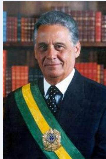
Presidente brasileiro Fernando Henrique que, em seu governo, promoveu uma série de privatizações de empresas pública.