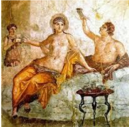
Fresco de uma casa de Herculano

A arte romana também se fez presente na decoração. Em Pompéia, veremos o luxo das casas com suas paredes decoradas, mosaicos diversos e utensílios domésticos.