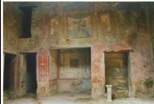
Pinturas a fresco das paredes de uma casa em Pompeia

A maioria das pinturas romanas da época encontra-se nas cidades de Pompéia e Herculano, soterradas pela erupção do vulcão Vesúvio em 79 d.C. As pinturas de Pompéia foram descobertas no séc. XVIII – fazem parte da decoração das paredes internas dos edifícios. Nessa época os pintores decoravam as paredes com uma camada de gesso pintado imitando placas de mármore. Mais adiante os pintores descobriram uma nova técnica na pintura que dava a impressão de um bloco saliente de mármore, apenas como pintura, sem a necessidade do uso do gesso. Essa descoberta levou a outra técnica que dava a impressão de profundidade. Foi então, o início de pintar grandes painéis que davam a ideia de janelas abertas onde se apreciava a paisagem com pessoas e animais. Outras pintavam enormes painéis com barrados, pessoas formando a pintura de um enorme mural. Os artistas