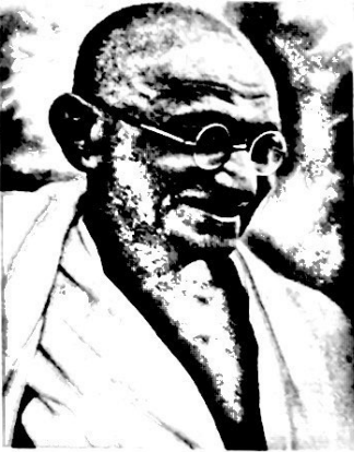
Líder pacifista indiano Mahatma Gandhi, 1969