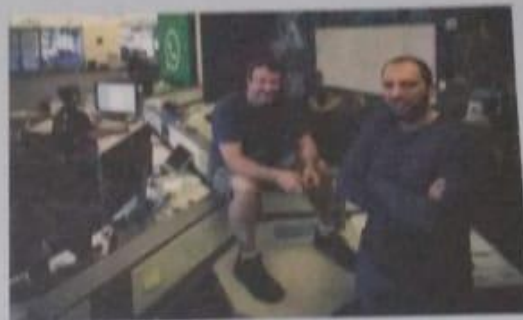
Brian Acton (sentado) e Jan Koum

Jan Koum e Brian Acton, os criadores do Whatsapp, saíram do Yahoo em 2007. Depois, procuraram empregos no Facebook, Twitter e outras empresas de tecnologia, mas não obtiveram sucesso.