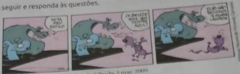
GONSALES, Fernando. Folha de S.Paulo, 1 mar. 2009

5 Leia a tira a seguir e responda às questões.