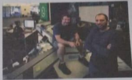
Brian Acton (sentado) e Jan Koum

Jan Koum e Brian Acton, os criadores do Whatsapp, saíram do Yahoo em 2007. Depois, procuraram empregos no Facebook, Twitter e outras empresas de tecnologia, mas não obtiveram sucesso.