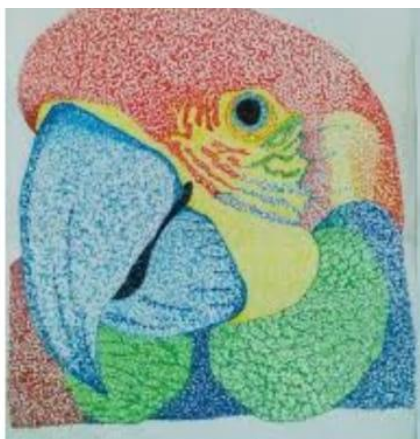
Técnica de pontilhismo... | Po... pinterest.com