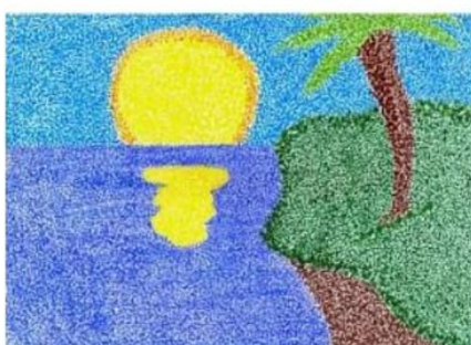
Técnicas de Pontilhismo, Pint... ijfc.org.br