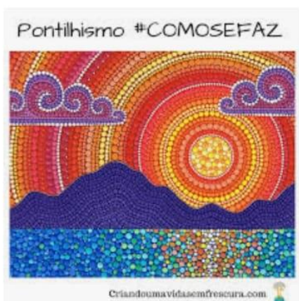
Pontilhismo #COMOSEFAZ / ... criandoumavidasemfrescura.com