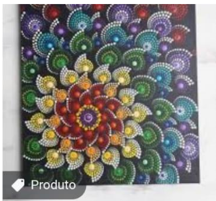
Mandala pintada em tela 27x... elo7.com.br