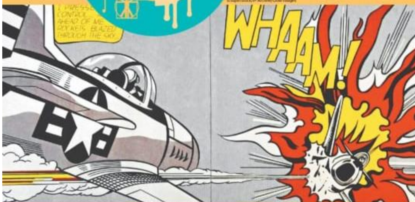
LICHTENSTEIN, Roy. Whaam!. 1962. 1. Acrílica e óleo sobre tela, color., 178 cm x 400 cm. Galeria Tate, Londres, Reino Unido.