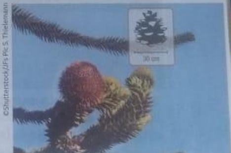
Estróbilo feminino da Araucaria angustifolia

Nos estróbilos femininos, são geradas as oosferas, gametas femininos, e nos estróbilos masculinos, encontram-se os grãos de pólen, formados pelo gameta masculino, e a parede polínica, que o protege. Esses grãos são produzidos em grande quantidade e transportados até o estróbilo feminino, principalmente pelo vento. Esse tipo de polinização realizada pelo vento é chamada de anemofilia .