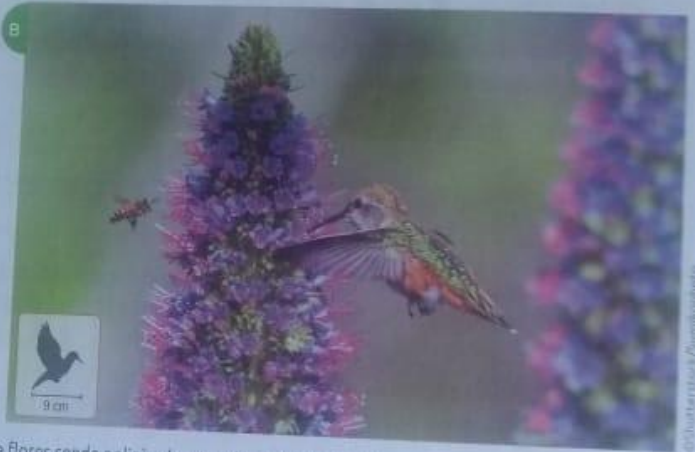
Flor masculina do milho polinizada pelo vento (A), e flores sendo polinizadas por pássaros e insetos (B)

Algumas espécies de plantas podem realizar autofecundação, quando uma mesma flor, por meio de suas estruturas próprias, realiza o transporte de pólen. A maioria delas, porém, depende de agentes para que a polinização aconteça.