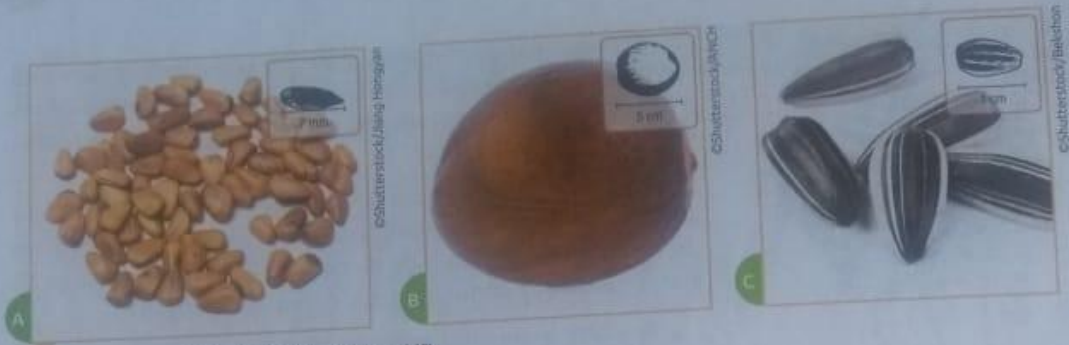
Sementes de Pinus (A), de abacate (B) e de girassol (C)