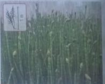
Pteridófitas do gênero Equisetum , do grupo das cavalinhas. Originárias da Europa, Ásia e América do Norte, podem ser encontradas no Brasil.