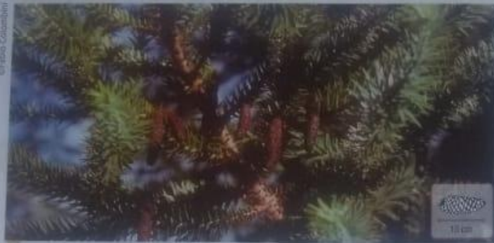
Estróbilo masculino da Araucaria angustifolia .

Os estróbilos são masculinos ou femininos e podem estar na mesma planta ou em plantas diferentes, como é o caso do gênero Araucaria , que apresenta plantas exclusivamente masculinas e exclusivamente femininas.