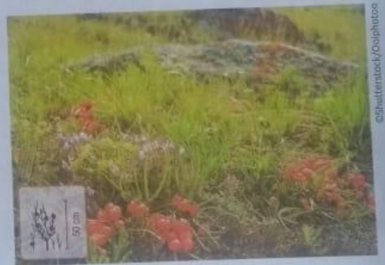
Gimnosperma do gênero Ephedra encontrada em regiões áridas.