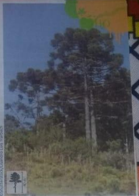
Araucaria angustifolia , conhecida como pinheiro-do-paraná