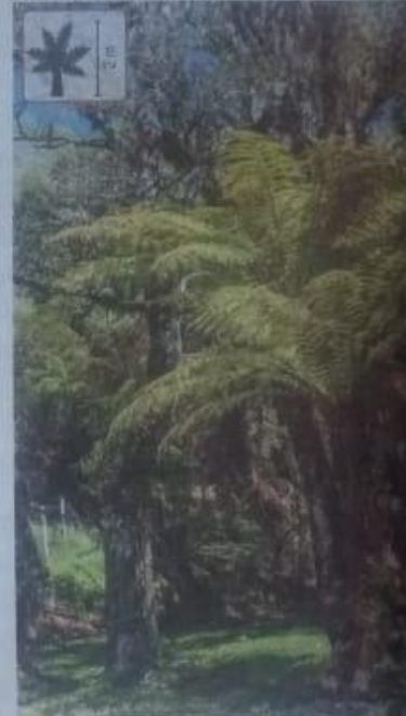
Xaxim, da espécie Dicksonia sellowiana , que pode chegar a 2 metros de altura. [6]