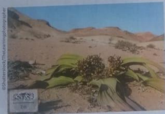
Gimnosperma do gênero Welwitschia , encontrada em desertos.

Essas plantas, que também têm vasos condutores de seiva, podem ser encontradas em diferentes ecossistemas, desde desertos (em que há espécies do gênero Welwitschia ) e outras regiões áridas (nas quais há do gênero Ephedra ) a locais com neve (onde há presença de pinheiros e ciprestes, chamados de coníferas).