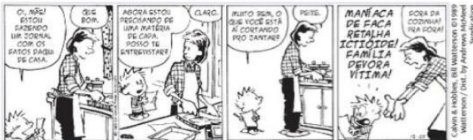
Calvin e Hobbes © 1999 Watterson/Dist. by Universal Uclick WATTERSON, Bill.

a) Consulte o dicionário e registre o significado de "ictioide".