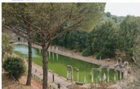
NGUYEN, Marie-Lan. Vista da Vila de Adriano em Tivoli, Roma, construída aproximadamente em 125 d.C. 2006. 1 fotografia, color.

Na escultura, buscava-se retratar as pessoas de forma realista. Os magistrados encomendavam esculturas de si e de seus familiares para colocá-las em praças, monumentos, no fórum da cidade e em suas casas e vilas.