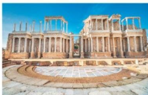
CALZADA, David H. Teatro romano em Mérida, Espanha, construído aproximadamente em 15 a.C. 2019. 1 fotografia, color.

Apesar da inspiração na dramaturgia helênica, os romanos adaptavam as obras conforme suas necessidades e seu modo de vida.