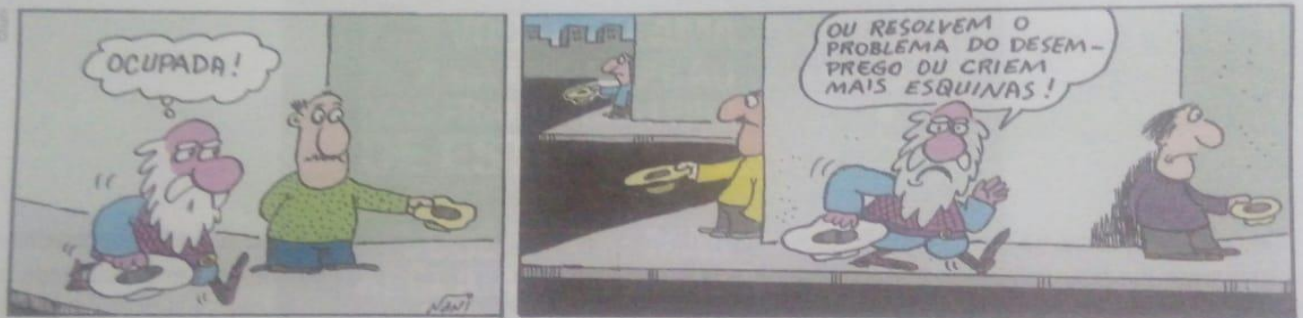
NANI. Versus tropical . Rio de Janeiro: Record, 1984, p. 5.

Como o nome sugere, expressa relação de alternância, opção ou exclusão.