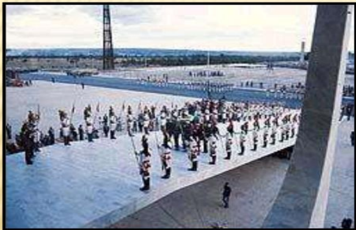
Funeral de Tancredo Neves