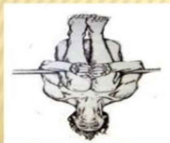
Pau de arara