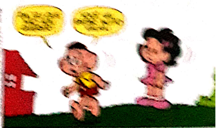
WETA, Maurício de. Cacá, O Grande . Maurício de Weta. Prologos Ltda, 1994.

Considerando a fala de menino no primeiro quadrinho e a que se refere ao menino Cacá, qual seria o significado da locução verbal?