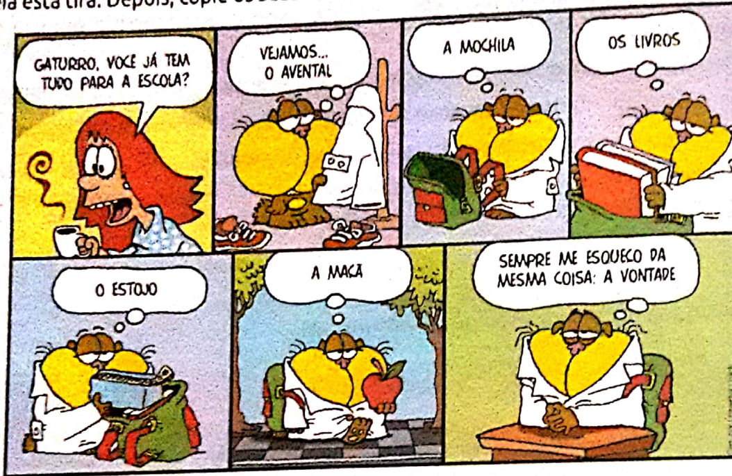
NIK. Gaturro 2. São Paulo: Vergara e Riba Editoras, 2008. p. 7.

1 Leia esta tira. Depois, copie os substantivos listados por Gaturro.