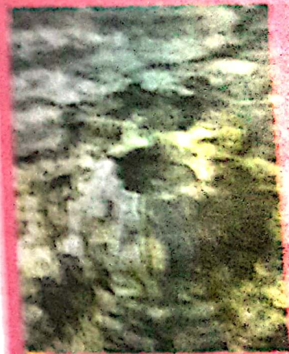
Close-up de fóssil fossilizado por madeira carbonizada preservada em rocha.

Nota: Fóssil é a impressão ou a preservação de uma planta ou animal em um material durável, geralmente rocha.