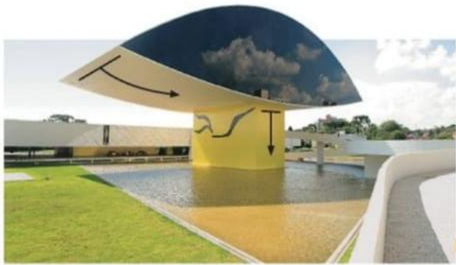
Museu Oscar Niemeyer, Curitiba, Paraná, Brasil

Se a linha é um ponto em movimento, o plano pode ser compreendido como o resultado de uma linha em movimento. Podemos considerar como plano uma dada superfície, uma folha de papel, por exemplo. Os planos apresentam duas dimensões, podendo ser retos ou curvos. Observe a imagem: a parte de cima da construção contém dois planos curvos que criam a forma de um olho, e a parte de baixo é formada por planos retos.