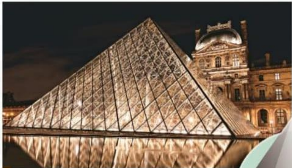
Museu do Louvre, Paris, França

Quando juntamos planos distintos, acabamos por criar volumes. Observe as imagens.