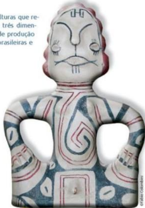
Cerâmica marajoara. Belém, Pará

▶ Exemplar da arte baga. Guiné, África. Essa grande máscara representa a fertilidade da mulher e da terra. Em cerimônias agrícolas, as mulheres as colocavam sobre os ombros, enxergando por meio de um buraco entre os seios esculpido