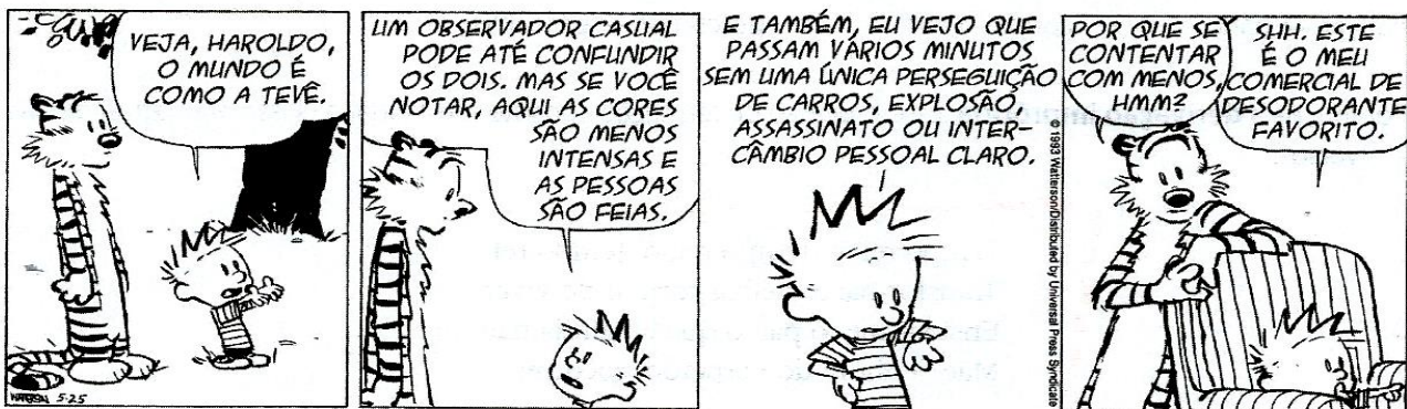
WATTERSON, Bill. Felino selvagem psicopata homicida . v. 2. São Paulo: Best News, 1996. p. 30.