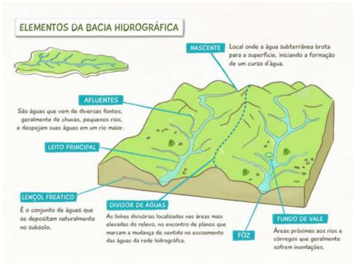
Figura 3: Esquematização de uma Bacia Hidrográfica.

Para entender a Hidrografia da América, é necessário compreender o que são bacias hidrográficas. Trata-se de sistemas compostos por rios afluentes que deságuam em um rio principal.