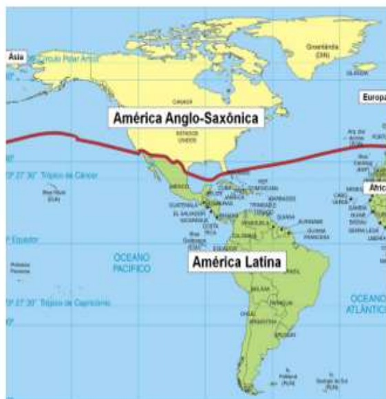
Figura 1: Os 2 tipos de regionalizações da América.

Fisicamente falando, as terras compostas pelo continente americano são consideradas geologicamente antigas, apresentando composições que foram muito transformadas pelos agentes externos ou exógenos de transformação do relevo. No entanto, há também algumas formas de relevo mais recentes, geralmente posicionadas em toda a sua